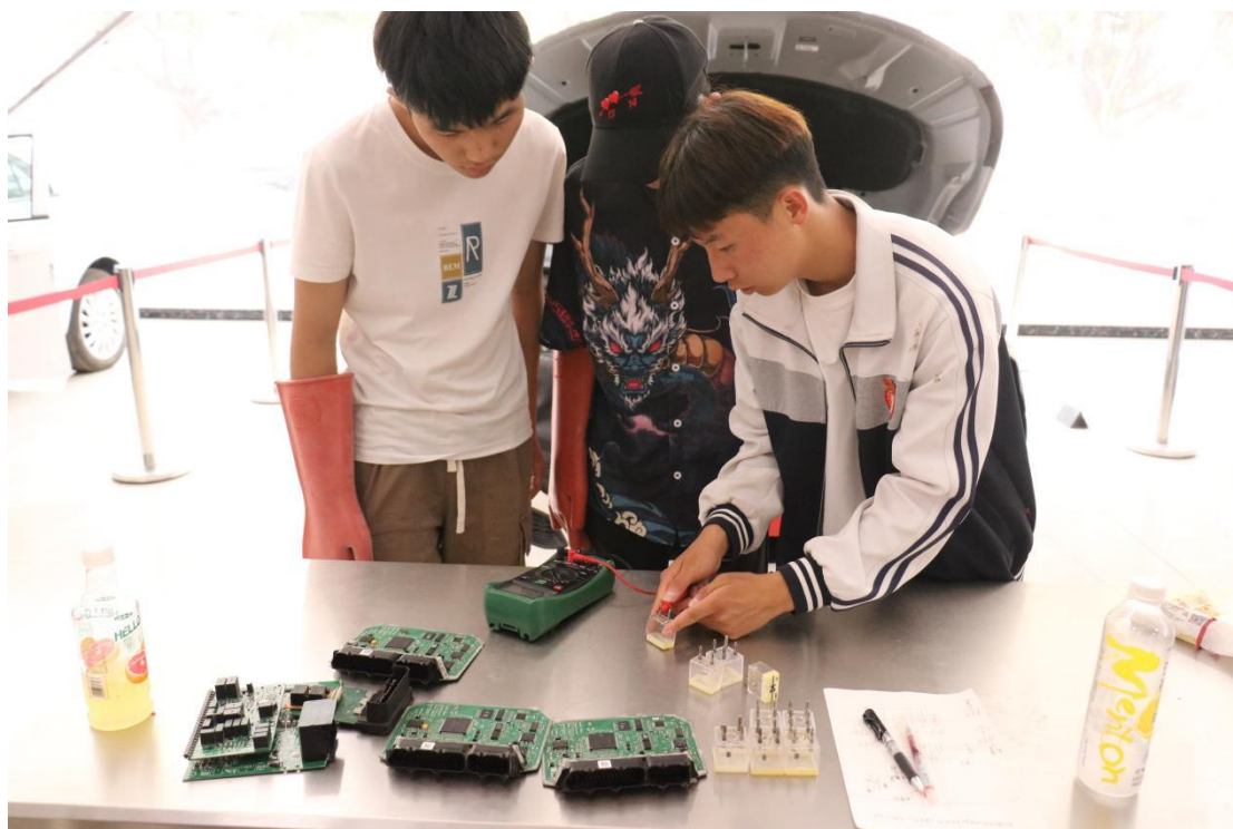
本次开幕式顺利拉开了我校 2024 年职业教育体验周暨第四届学生技能大赛活动