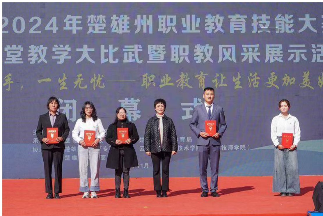
图 7:2024 年楚雄州职业院校技能大赛教师课堂大比武（专业实作课）参赛教师