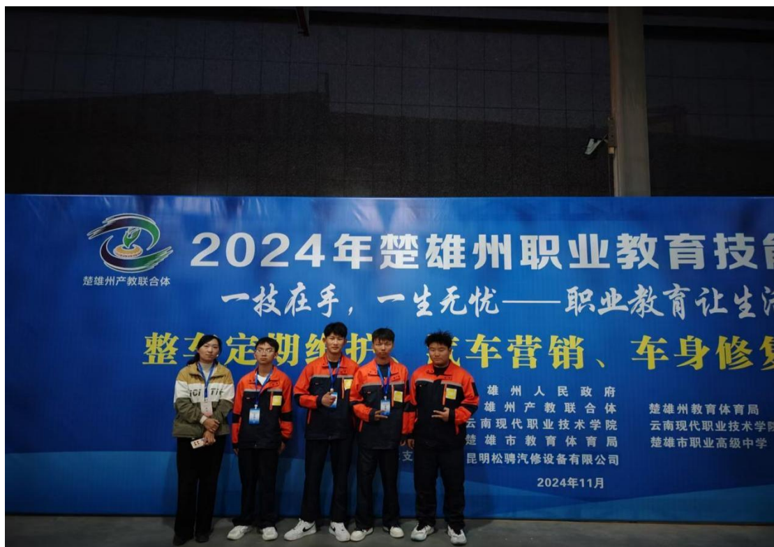
图 5:2024 年楚雄州职业院校技能大赛汽车营销参赛团队