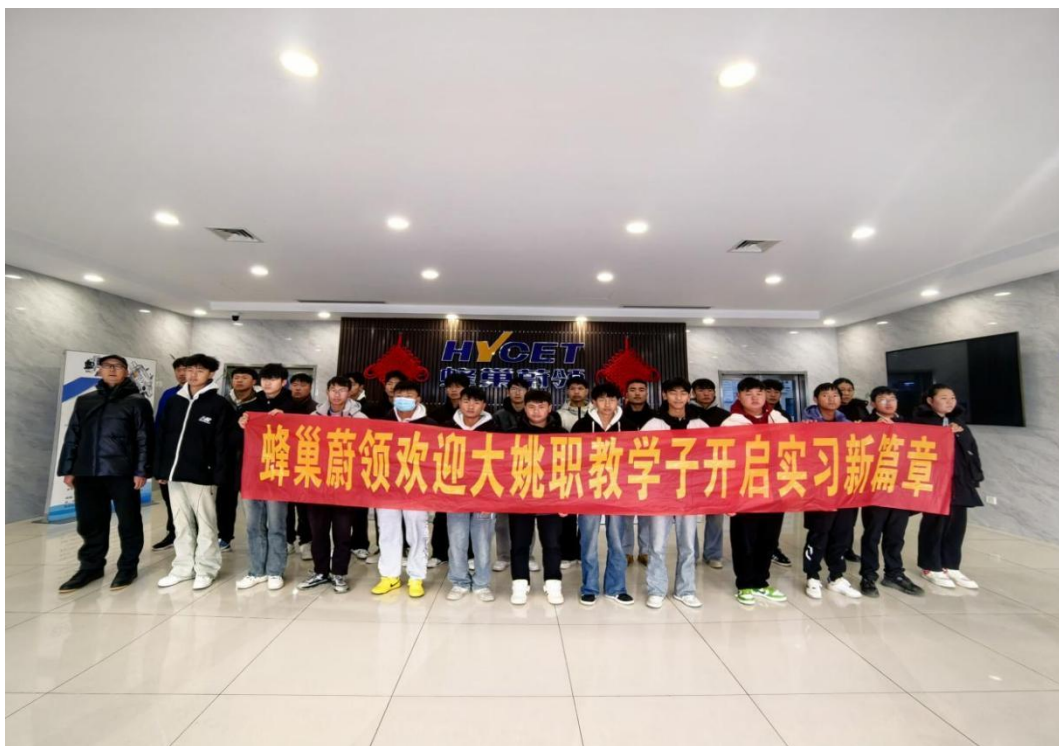
图 1: 机电专业的学生到江苏蜂巢蔚领实习

学生就业前，学校按计划对学生开展岗前培训，提高学生就业技能，培养学生就业能力。以提高学生就业能力为本设置课程，学校先后为高三学生开设了“职业生涯规划”“就业指导”等课程，为学生量身定做课程，有效提高学生岗前就业能力。加强对学生的职业理想、职业道德、就业观和创业意识教育，让学生了解自己的性格特征、兴趣爱好、能力特长，求职技巧、面试前的准备等。引导学生树立正确的职业理想和就业观，对自己做出合理的定位。做好自己职业生涯的规划、设计，争取为社会输送合格毕业生。在全校开展就业、创业专题讲座教育。邀请了多家企