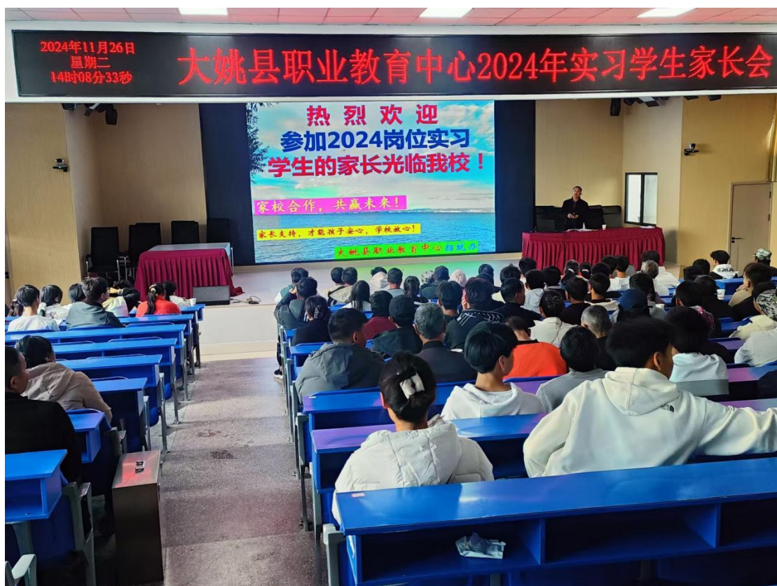
图 2：召开 2024 年实习学生家长会

业给就业学生做讲座，帮助他们认识职业的含义和作用，唤起他们就业、创业意识，引导学生树立职业理想，做好职业规划和创业准备，为今后的学习方向，打下良好的基础。招生就业办召开就业学生家长会，对学生进行职业道德教育、法纪教育、防诈骗教育、安全意识教育，及时解决学生就业工作中的困难，让学生能安心工作。