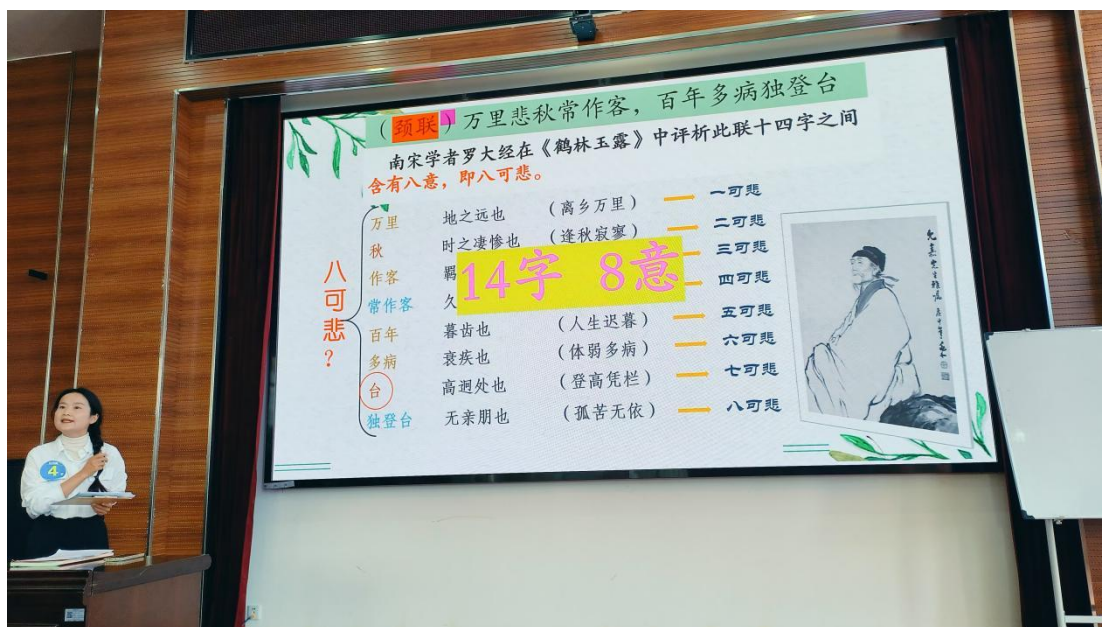
图 8:2024 年楚雄州职业院校技能大赛教师课堂大比武（公共课）参赛教师