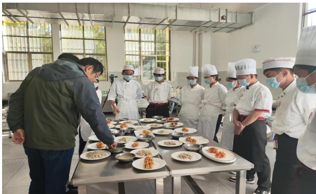
图 10：中餐烹饪专业技能等级证书考试现场