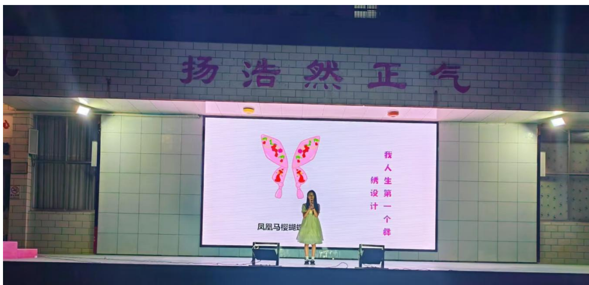
图 12:2024 年“唱响青春 放飞梦想”校园歌手大赛

姚县职业教育中心 2024 年秋季学期文艺活动在学校绿草坪运动场隆重举行，全校师生参加了本次活动。本次文艺活动分为三场举办。