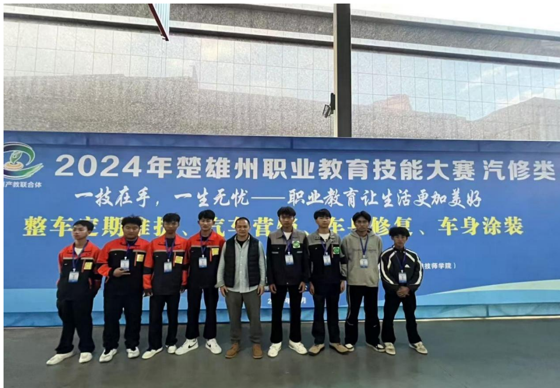
图 6:2024 年楚雄州职业院校技能大赛整车定期维护参赛团队