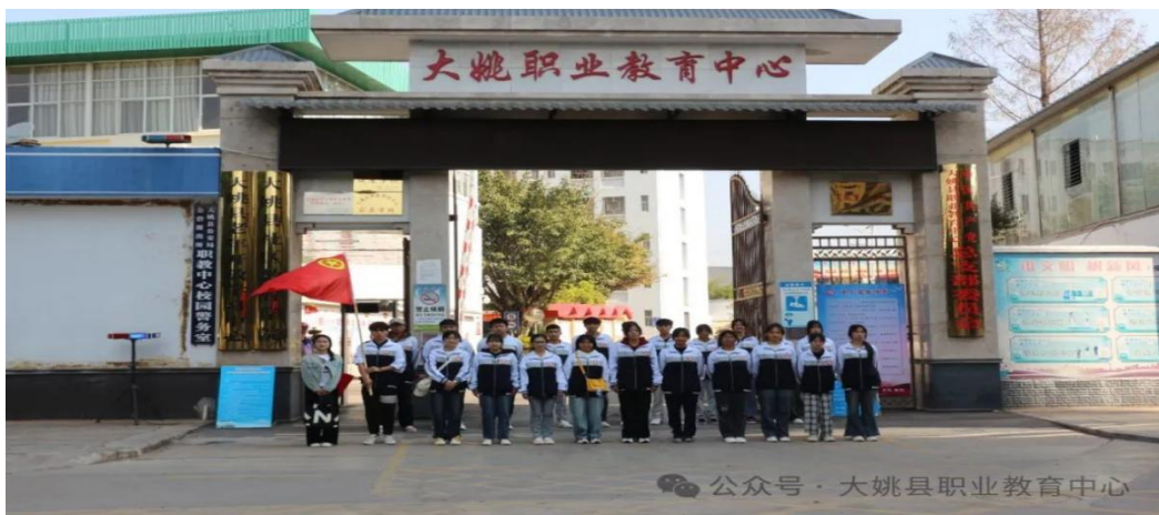
【团旗飘飘，学生整装待发准备参加此次活动】

为传承雷锋精神，弘扬时代新风。2024 年 3 月 17 日早晨，沐浴着三月的暖阳，大姚县职业教育中心团委组织师生志愿者到大姚县农贸市场开展了义务送水和职教宣传活动，学校全体党政领导和部分学生代表共计 40 余人参加了活动。