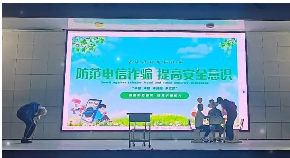
图 14:2024 年“他们的故事我来传”励志故事会

这场“追逐光，成为光”演讲比赛，宛如一场青春的盛宴，它在校园里种下了无数逐光的种子。相信在未来的日子里，这些种子将生根发芽，茁壮成长，让每一位同学都成为那束照亮自己、温暖他人的光，让逐光精神在校园里熠熠生辉，永远延续下去。