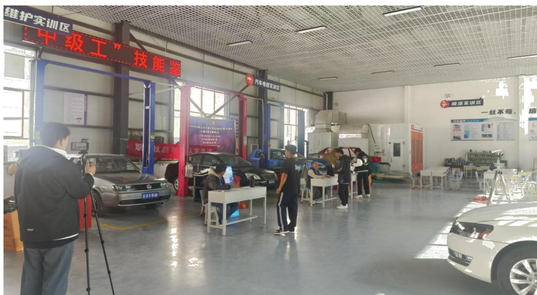
图 9：汽车运用与维修专业技能等级证书考试现场

平，也为学生顺利进入职场做好铺路搭桥准备。推动“岗课赛证”深度融合，课程建设突出德技并修，即注重技能培养，也重视职业素养、职业认同的提升。