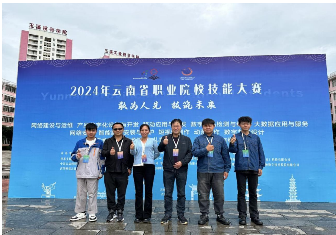
图 3:2024 年云南省职业院校技能大赛焊接技术、产品数字化设计与开发参赛团队